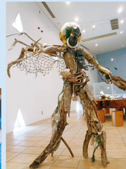
海洋ごみアート作品