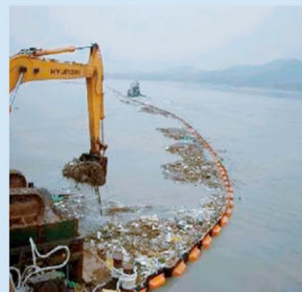
韓国の河口域に設置されたごみフェンス