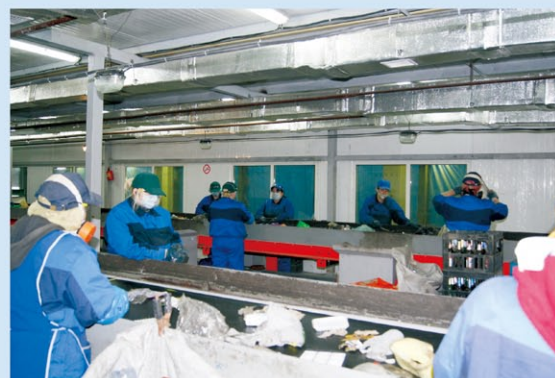
ウラジオストックのごみ分別施設

ロシアでは、収集した廃棄物を分別し、使えるものはリサイクルする複合的な廃棄物処理施設が稼働を開始しました。