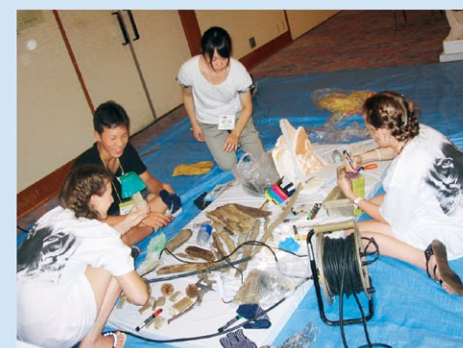
子どもたちによる海洋ごみアート作品の制作