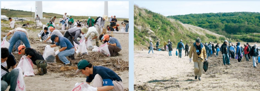
山形県、ロシアのウラジオストックで開催されたNOWPAP ICCの様子

✓ NOWPAPでも、各国における普及啓発を目的としてICCキャンペーンを実施しています。