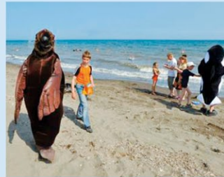
ロシア、サハリンのアニーバ湾における海岸清掃

ロシアでは、コカコーラ社、VostokStroySerice 社、PrimVodoKanal 社が陸域からの海洋ごみの発生抑制を目的とした環境教育活動を展開しています。